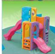
YL-HT032 豪华组合城堡滑梯 定价:6800元