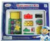
YL-GT013 GH-580 电子积木 价格: 910元 规格: 34×27.5×5cm