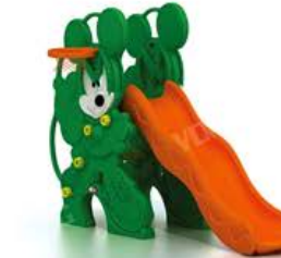
YL-HT014 米奇奇滑梯 Size: 152x80x112cm 定价: 2780元