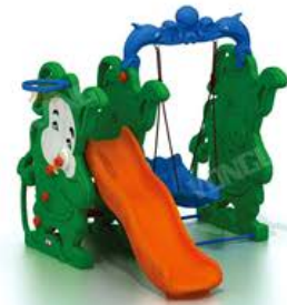
YL-HT008 猪宝宝滑梯秋千组合 Size: 160x173x138cm 定价: 4200元