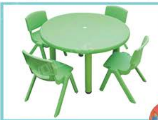
YL219-6 圆桌 规格：120×60×45、50、55cm 定价：1200元