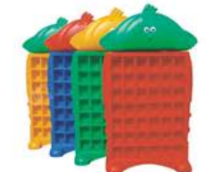
YL-KB0003 鸡宝宝口杯架 规格: 70x18x125cm 定价: 1580元