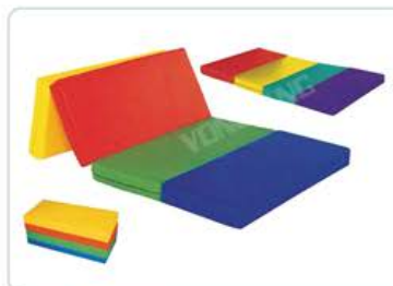
YL 61096 四联地席 规格/size: 200*70*10cm 定价/price: 2180.00