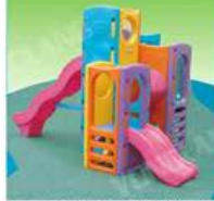
YL-HT032 豪华组合城堡滑梯 定价: 6800元