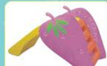
YL-HT034 草莓滑梯 定价:1780元