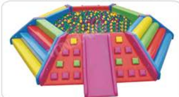
YL 61101 多功能六角形球池(不含球) 规格/size: 350*350*60cm 定价/price: 29800.00