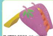
YL-HT034 草莓滑梯 定价: 1780元