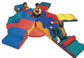
YL 61019 攀爬软体组合 规格/size: 270*240*50cm 定价/price: 19800.00