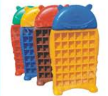
YL-KB0001 熊宝宝口杯架 规格: 70x18x125cm 定价: 1580元