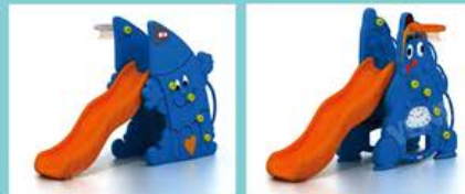
YL-HT010 铅笔娃娃滑梯 Size: 152x80x108cm 定价: 2780元

YongLang的产品是针对儿童的玩具或幼儿园的幼教设施。由于玻璃钢制品在阳光下容易产生微量有害气体，在发达国家同行纷纷将原材料由玻璃钢更换为塑料后，浪潮公司通过三年的研制，采用滚塑技术并于2000年开始批量生产塑料玩具。紧跟国际先进的制造工艺水平。浪潮公司通过ISO9000国际体系认证，注重生产过程中的质量控制，使高品质的大型儿童游乐设施源源不断进入国内各大城市。在不懈的努力下，浪潮公司又通过了CE认证和TUV德国公司的认证，使产品进入欧洲、美国和东南亚市场。