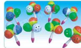
YL238-4 健身有声舞蹈铃 40件/箱 定价: 358元