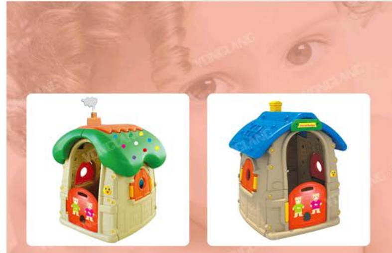
House Series YL-HS001 Dimension: 126x120x150cm Price: 8500(RMB)