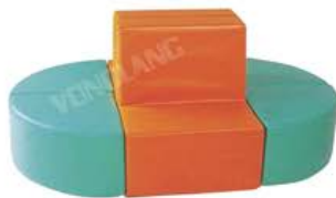
YL 61049 豪华靠背组合沙发 规格/size: 160*100*60cm 定价/price: 6000.00