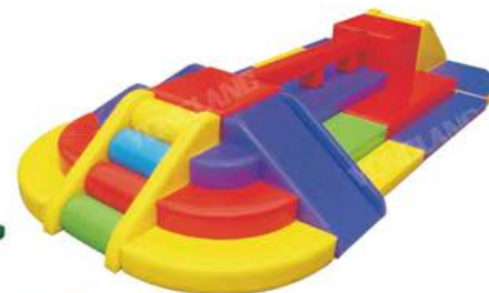
YL 61040 多功能平衡木组合 规格/size: 430*220*60cm 定价/price: 23800.00