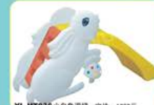
YL-HT036 小白兔滑梯 定价: 1780元