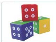
YL 61066 色子积木 规格/size: 30*30*30cm 30件/套 定价/price: 1380.00