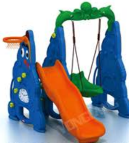
YL-HT009 可可茄子滑梯秋千组合 Size: 152x175x130cm 定价: 4200元