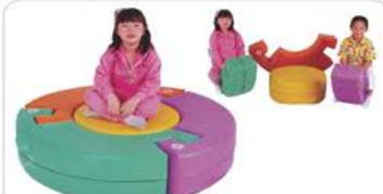
YL 61048 摇动马组合 规格/size: 120*120*20cm 定价/price: 5800.00