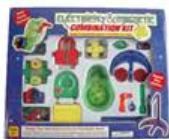
YL-GT012 GH-581 全能电学及磁力组 价格: 980元 规格: 38×8×33cm