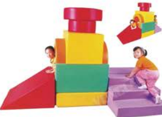
YL 61007 宝贝游戏组合 规格/size: 180*120*100cm 定价/price: 11800.00