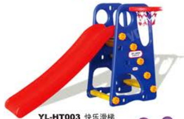
YL-HT003 快乐滑梯 Size: 161x83x103cm 定价: 1880元