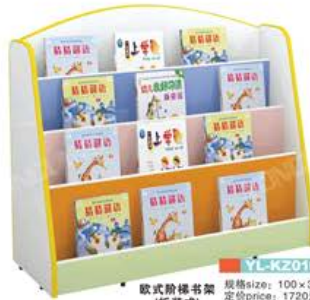
YL-KZ010 款式阶梯书架 (拆装式) 规格size: 100 x 35 x 90cm 定价price: 1720元/个 双菌防火色板