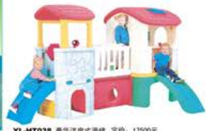
YL-HT038 豪华洋房式滑梯 定价: 17500元