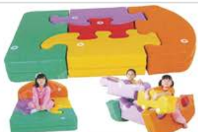
YL 61047 动物床 规格/size: 150*100*20cm 定价/price: 5800.00