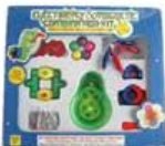
YL-GT014 GH-594 手动发电机及磁力组 价格: 450元 规格: 29.5×8.5×26cm