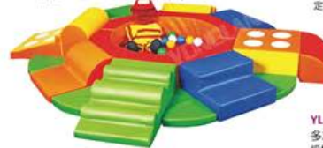
YL 61103 婴儿球池(中心不含球) 规格/size: 260*240*36cm 定价/price: 19800.00