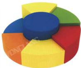
YL 61001 旋转攀爬 规格/size: 120*120*40cm 定价/price: 7800.00