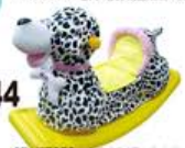
YL-HT059 毛球动物摇 (斑点狗) 定价: 560元