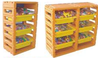
YL-KZ005 玩具架 Dimension: 51.2x31.4x82.3cm (H) Price: 1600(RMB/只)