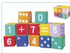
YL 61067 数字方块积木 规格/size: 25*25*25cm 12个/套 定价/price: 2880.00