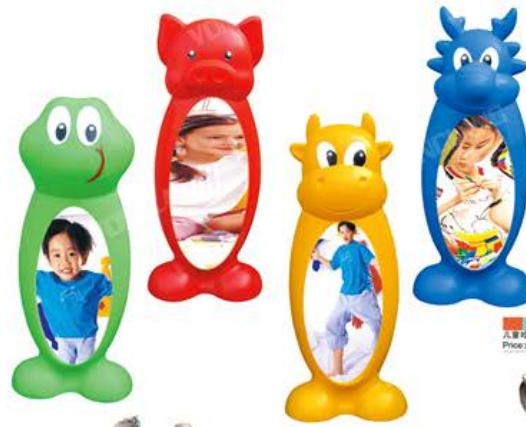
YL-KZ006 儿童哈哈镜 Price:xx(RMB)