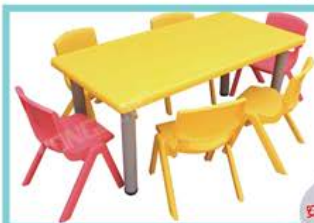
YL219-2 六座 规格：120×60×45、50、55cm 定价：1180元