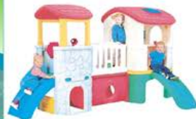
YL-HT038 豪华洋房式滑梯 定价:17500元