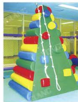
YL 61043 攀登架 规格/size: 110*110*180cm 定价/price: 29800.00