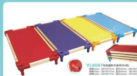
YL8087 彩色塑料木板床(共4色) 规格/size: 150×60×32cm 定价/price: 880.00元 规格/size: 138×60×32cm 定价/price: 780.00元 规格/size: 130×60×32cm 定价/price: 700.00元