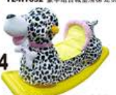
YL-HT059 毛绒动物摇 (斑点狗) 定价:560元