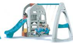
YL-HT037 豪华组合秋千 定价:13000元