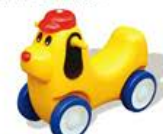
YL-HT030 猴猴小赛车 定价:450元