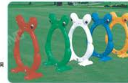
YL158-4 青蛙粘垫 规格: 70x90cm 定价: 1680元(5只/套)