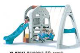
YL-HT037 豪华组合秋千 定价: 13000元