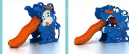
YL-HT012 猪宝宝滑梯 Size: 160x80x112cm 定价: 2780元