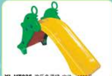
YL-HT035 欢乐鱼滑梯 定价: 1680元