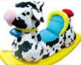
YL-HT061 毛球动物摇 (奶牛) 定价: 560元