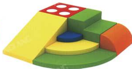
YL 61002 角落攀爬 规格/size: 120*120*36cm 定价/price: 6800.00