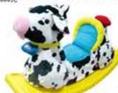
YL-HT061 毛绒动物摇 (奶牛) 定价:560元