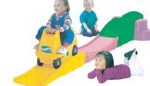
YL-GT003 三段式滑行梯 规格: 310x75x35cm 定价: 4250元