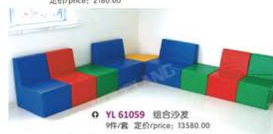
YL 61059 组合沙发 9件/套 定价/price: 13580.00