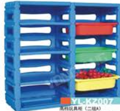
YL-KZ007 高档玩具柜 (二二级) 规格: 1018x314x823mm 定价: 3700元