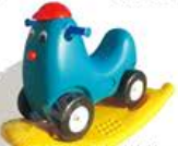
YL-HT031 双用小鸡摇摇车 定价:600元