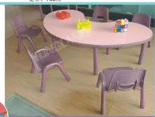
YL219-3 弯桌 规格：180×60×45、50、55cm 定价：1180元