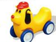
YL-HT030 趣味小狗车 定价: 458元