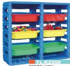
YL-KZ008 高档玩具柜 (二二级) 规格: 1018x314x823mm 定价: 3700元