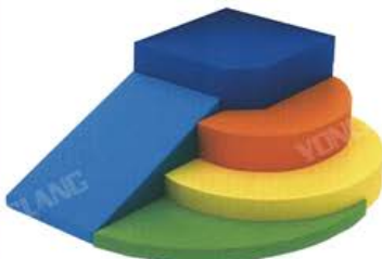
YL 61003 角落镜子游戏攀爬 规格/size: 133*112*90cm 定价/price: 7080.00