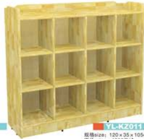
YL-KZ011 规格size: 120 x 35 x 105cm 定价price: 4300元/个 原木