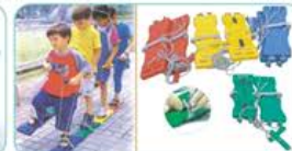
YL-GT008 体育游戏鞋 规格/Size: 39 5x1 5x2 5cm 定价: 580元