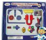
YL-GT015 GH-593 电学及磁力组 价格: 450元 规格: 31×3×27cm