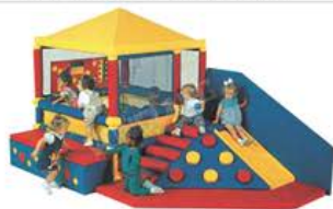
YL 61099 城堡球池(不含球) 规格/size: 480*240*240cm 定价/price: 32800.00