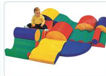
YL 61010 软体爬滑梯组合 规格/size: 180*180*38cm 定价/price: 15800.00