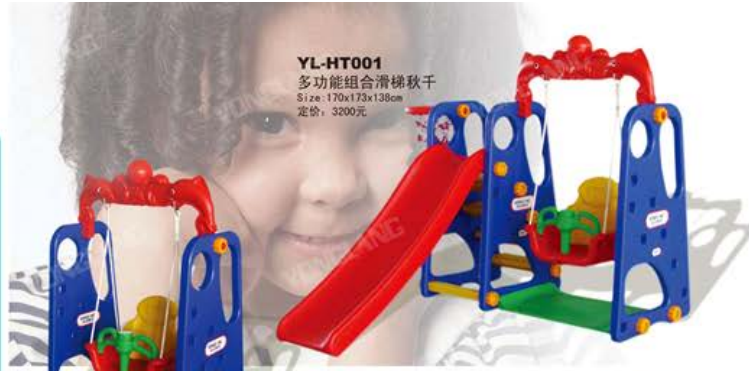
YL-HT001 多功能组合滑梯秋千 Size: 170x173x138cm 定价: 3200元