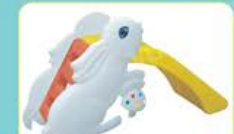
YL-HT036 小白兔滑梯 定价:1780元