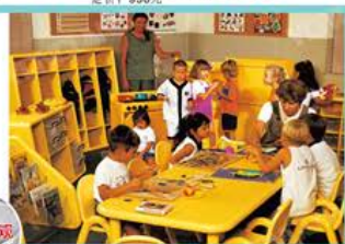
YL219-5 六座 规格：120×60×45、50、55cm 定价：780元