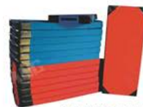
YL 61095 高级体操垫 规格/size: 150*60*10cm 定价/price: 1280.00