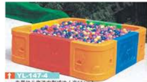
YL-KZ002 专用幼儿海洋球池 (高55cm) 3m 2 定价: 3800元 4.5m 2 定价: 4200元 6m 2 定价: 4900元 注: 加配上下滑梯780元