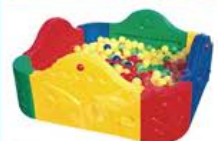
YL-155-8 十二生再海洋球池 规格: 84x58 定价: 3380元/套