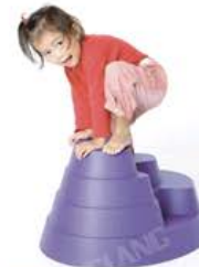
YL-GT001 我的小山 规格/Size: 40x49x65.5 定价: 1200元