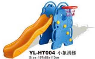
YL-HT004 小象滑梯 Size: 167x88x110cm 定价: 1880元