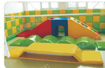
YL 61044 多功能爬滑组合 平衡桥 定价/price: 2880.00 波浪桥 定价/price: 2880.00 爬滑梯C型 定价/price: 6980.00