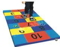
YL 61091 数字跳垫 规格/size: 200*80*5cm 定价/price: 1600.00