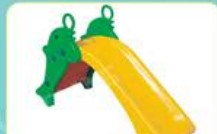
YL-HT035 欢乐鱼滑梯 定价:1880元