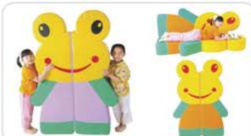
YL 61046 青蛙床 规格/size: 150*100*20cm 定价/price: 5800.00