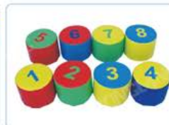
YL 61070 数字圆凳 规格/size: \phi 30 \times 20 cm 10个/套 定价/price: 3300.00