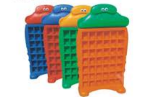
YL-KB0002 企鹅宝宝口杯架 规格: 110x18x110cm 定价: 1580元