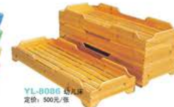
YL-8086 幼儿床 定价：500元/张