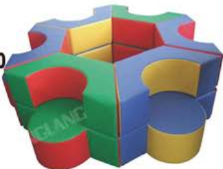
YL 61005 幼儿魔术围椅 规格/size: 180*180*40cm 定价/price: 22000.00