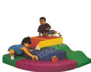
YL 61021 多功能爬滑组合 规格/size: 150*150*60cm 定价/price: 10800.00