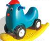
YL-HT031 双用小鸡摇摇车 定价: 660元