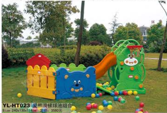
YL-HT023 爱熊滑梯球池组合 Size:240x130x114cm 定价: 3580元

Facilities being based on children characteristic property but developing a set of comprehensiveness designing that to play. It is to pass stereoscopic science combination but take form to agree to have playing, motion, body-building, are beneficial to wisdom, interest waits