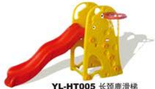
YL-HT005 长颈鹿滑梯 Size: 178x87x107cm 定价: 1780元