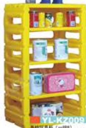
YL-KZ009 高档玩具柜 (一二级) 规格: 512x314x823mm 定价: 1980元