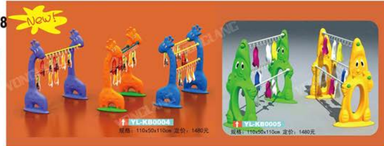
YL-KB0004 规格: 110x50x110cm 定价: 1480元